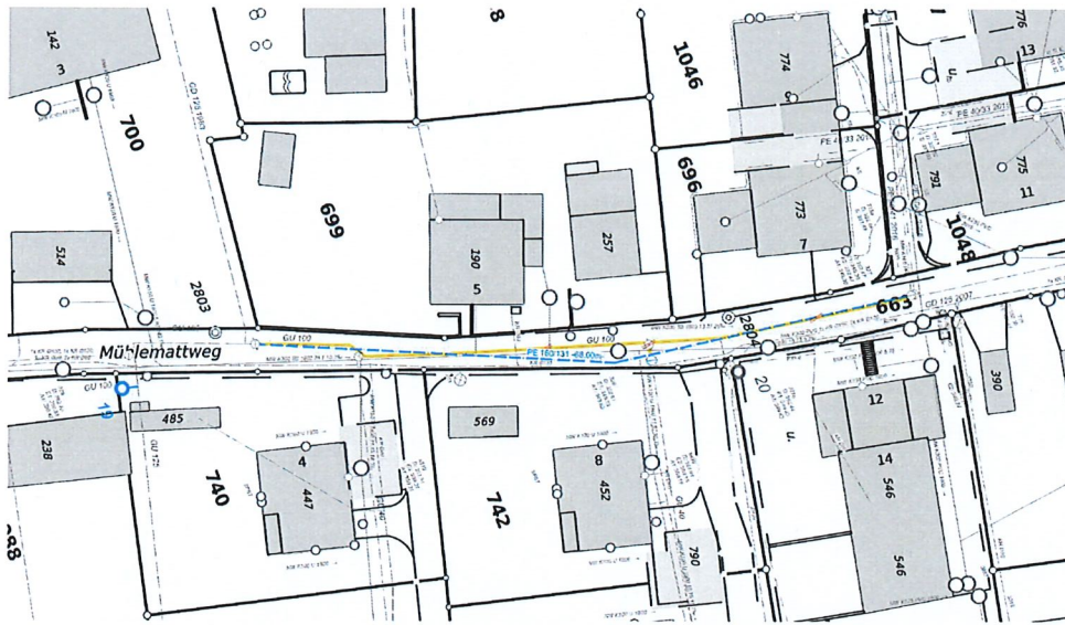
Abbildung 2: Planausschnitt Projekt Mühlemattweg