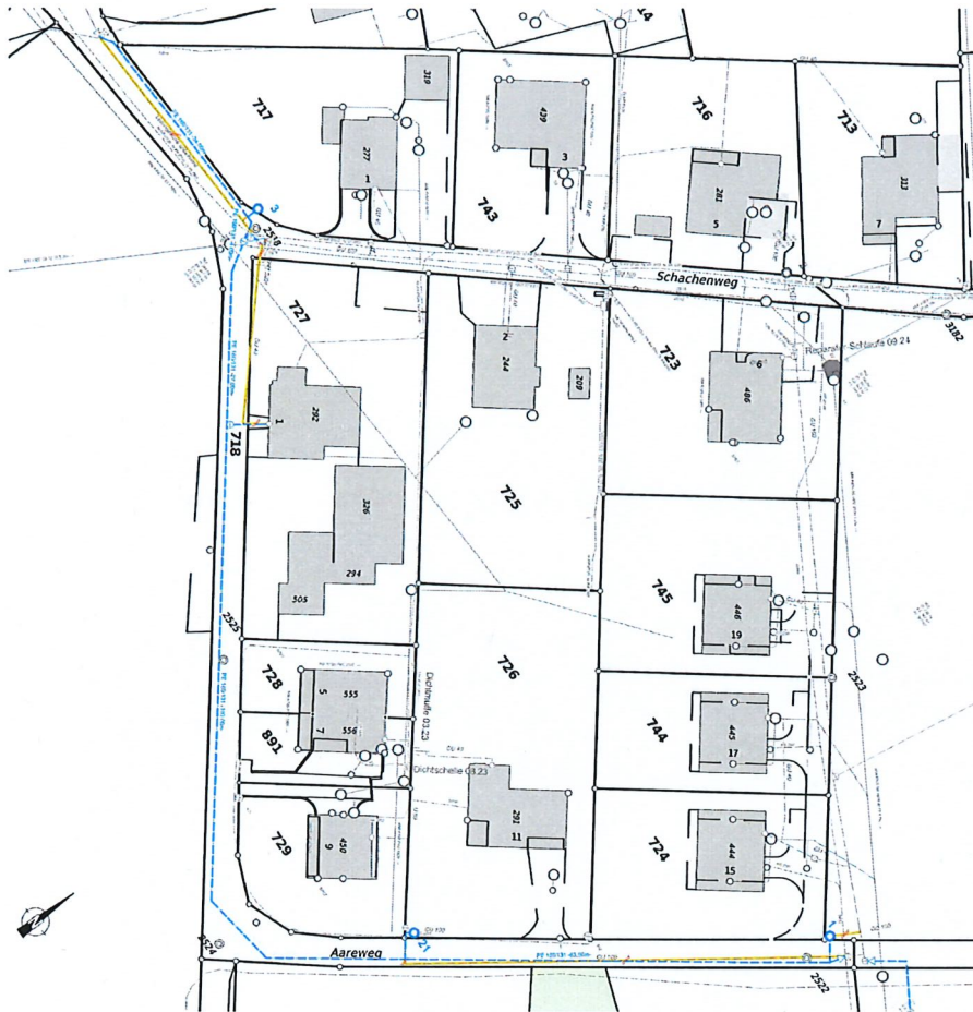
Abbildung 3: Planausschnitt Projekt Aareweg