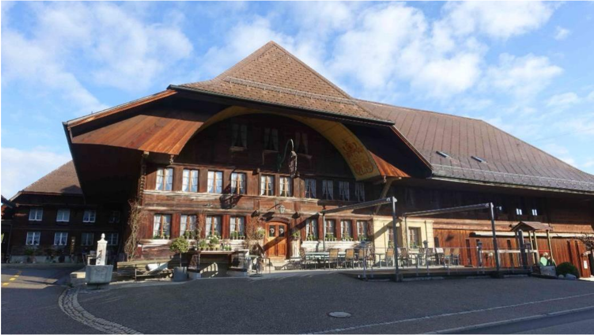
Restaurant «Kreuz» Sumiswald