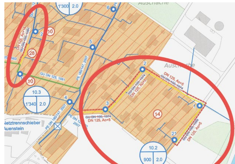
Abbildung 2: Auszug GWP, Bereich Mühlemattweg links, Bereich Aareweg rechts

Im Zusammenhang mit dem Ersatz der Abwasserdruckleitung beim PW Au und mit dem Ersatz des PW Au hat die AEW Energie AG Netzerneuerungen im Mühlemattweg sowie im Aareweg projektiert. In diesen Bereichen sind ebenfalls gemäss generellem Wasserversorgungsplan GWP die Massnahmen (Nr. 28 und Teil Nr. 14) vorgesehen. Zudem wird durch den Ringschluss im Aareweg sichergestellt, dass die Versorgungssicherheit und der Brandschutz (insbesondere Hydrant Nr. 21) gewährleistet sind.