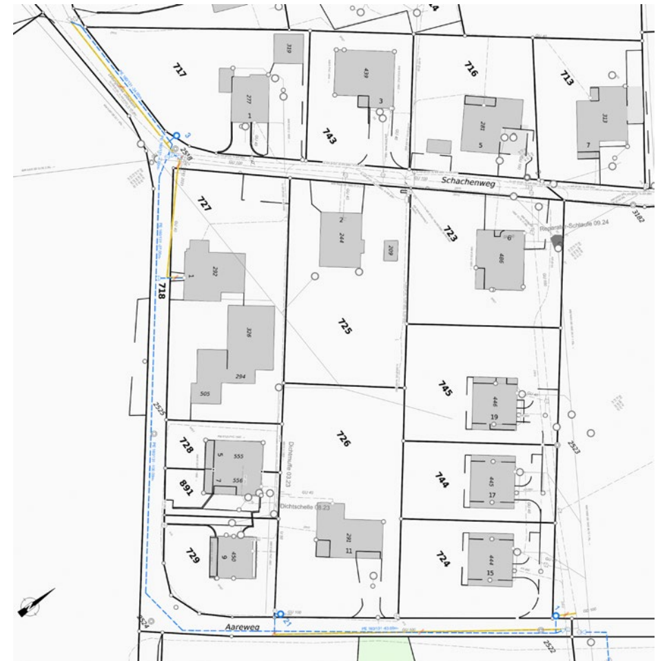
Abbildung 4: Planausschnitt Projekt Aareweg