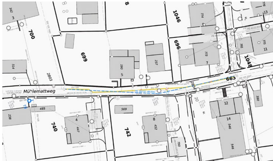
Abbildung 3: Planausschnitt Projekt Mühlemattweg

Die Gemeinde Veltheim beauftragte die Porta AG, ein Bauprojekt für die Massnahmen an der Trinkwasserleitung zu erstellen. Die Massnahmen aus dem GWP wurden dabei berücksichtigt.